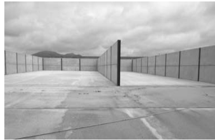
साइलेज बनाने के लिए जमीन के ऊपर संरचना