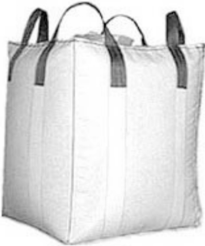
साइलेज बनाने के लिए थैला

कम मात्रा में साइलेज बनाने के लिए आजकल बाजार में प्लास्टिक की पीपे और थैले उपलब्ध हैं। साइलेज वाले थैले अलग-अलग साइज के होते हैं। जैसे कि 2 क्विंटल, 5 क्विंटल